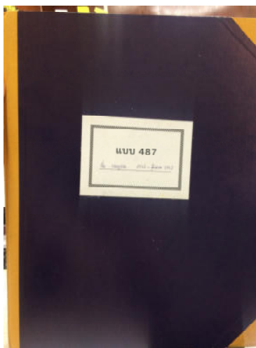
บัญชีสารบบคดี หรือแบบ ๔๘๗

บัญชีสารบบคดี หรือแบบ ๔๘๗ คือ บัญชีที่ระบุนายละเอียดคดีโดยย่อ และบันทึกขั้นตอนดำเนินคดีจนกระทั่งมีการอนุมัติปิดแฟ้มคดี โดยนิติกรจะเป็นผู้บันทึกข้อมูลที่เกี่ยวข้องกับการดำเนินคดี ได้แก่ เลขที่แฟ้มคดี วันเดือนปีที่ตั้งแฟ้มคดี ชื่อผู้กล่าวหา ชื่อผู้ถูกกล่าวหา เรื่องที่กล่าวหา (พฤติการณ์แห่งคดี) ของกลาง และขั้นตอนการดำเนินคดีดำเนินการถึงขั้นตอนใด